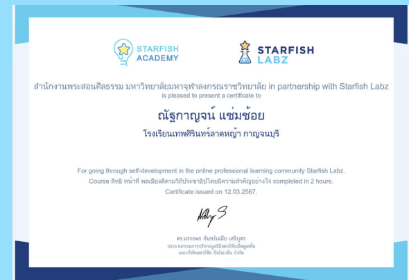
สิทธิหน้าที่พลเมืองดีตามวิถีประชาธิปไตย