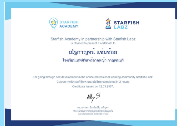
เทคนิคและวิธีการสอนสมัยใหม่