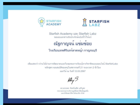
คุณสมบัติของครูในศตวรรษที่ 21