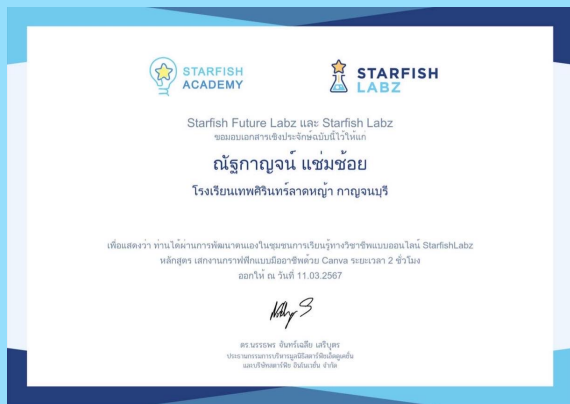
เสกงานกราฟฟิกแบบมืออาชีพด้วย Canva

มีการพัฒนาตนเองอย่างเป็นระบบและต่อเนื่อง เพื่อให้มี ความรู้ความสามารถ ทักษะ โดยเฉพาะอย่างยิ่งการใช้ภาษาไทยและ ภาษาอังกฤษเพื่อการสื่อสาร และ การใช้เทคโนโลยี ดิจิทัล เพื่อ การศึกษา สมรรถนะวิชาชีพและความรอบรู้ในเนื้อหาวิชาและ วิธีการสอน และ นำผลการพัฒนาตนเองและพัฒนาวิชาชีพมาใช้ในการจัดการเรียนรู้ที่มีผลต่อคุณภาพผู้เรียน