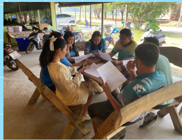
ดำเนินการประชุมกลุ่ม PLC