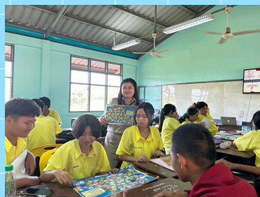
ดำเนินการกิจกรรมกลุ่ม PLC