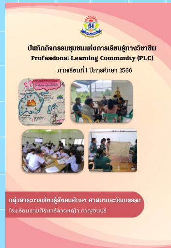
บันทึกกิจกรรมกลุ่ม PLC