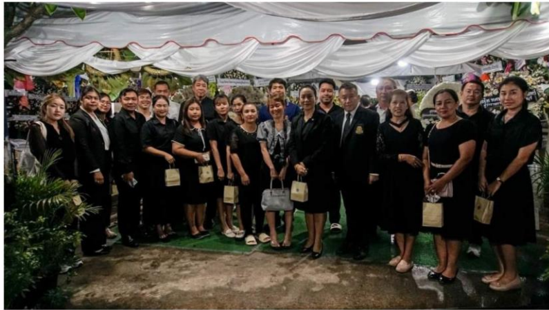
ร่วมฟังพระอภิธรรมศัพทภรยาประธานคณะกรรมการสถานศึกษา